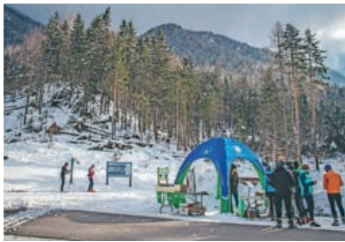
Dan teka na smučeh