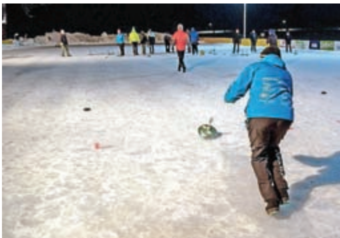
Pri igranju curlinga

Ob tem vse prebivalce Jezerske doline vabim, da spremljate naše objave na družbenem omrežju, kjer objavljamo prihajajoče dogodke, in se nam pridružite pri vseh športnih dogodkih. Naša stran na družabnem omrežju ni samo za vabljenje na prireditve in ostale aktivnosti društva, temveč tudi za komentiranje, kritiziranje, hvaljenje, sodelovanje in svetovanje za čim boljše delovanje našega društva.