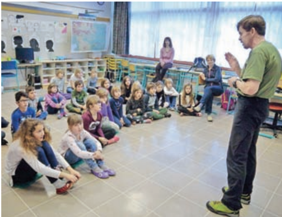
Otroci so z zanimanjem prisluhnili lovskemu čuvaju Davu Karničarju.