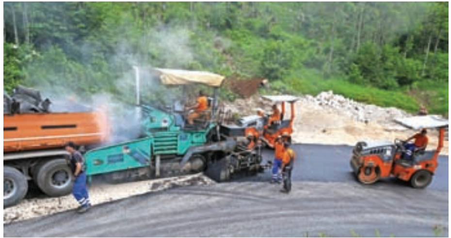
Prizor je z asfaltiranja t. i. prve ride na cesti proti Jezerskemu vrhu.

V tem času so v občini preplastili še dve cesti: ena gre čez Gaštej, druga je na začetku doline Komatevre. Asfaltiranje ceste čez Gaštej je bilo načrtovano že dolgo. Na novo asfaltirana cesta je pri-