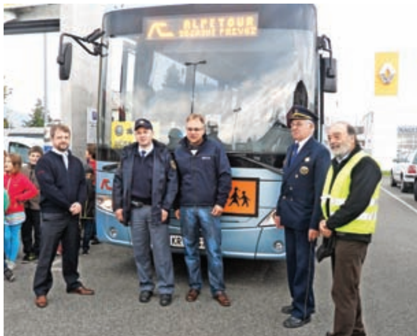
Izvajalci učne ure v Kranju