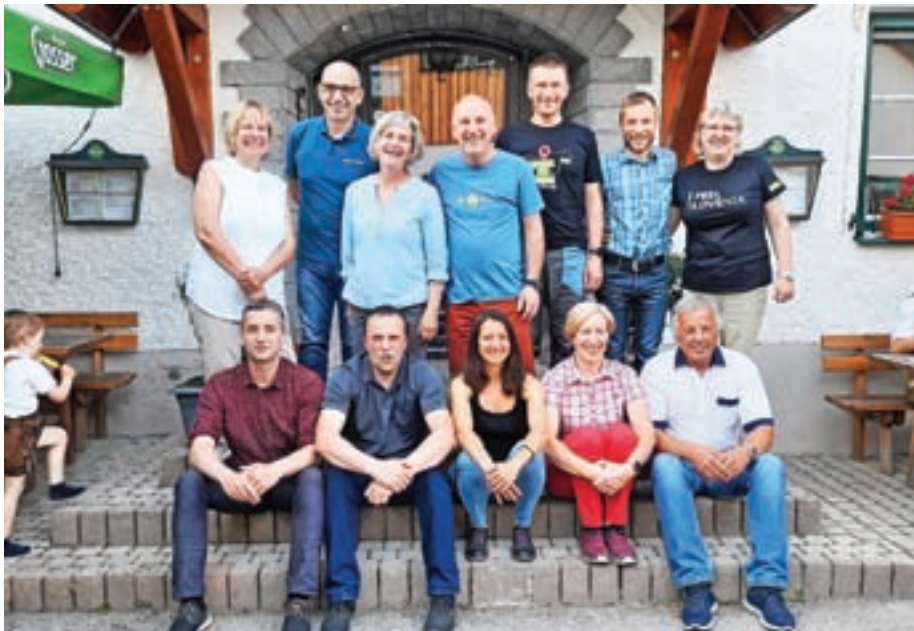
Predstavniki slovenske delegacije na srečanju mreže Gorniških vasi.

Ker Johnsbach leži na obrobju narodnega parka Gesäuse, je bila tema tokratnega srečanja Varstvo narave in turizem v harmoniji. Konkretni primer parka Gesäuse namreč kaže na to, da je naravi prijazen turizem v Alpah mogoč.