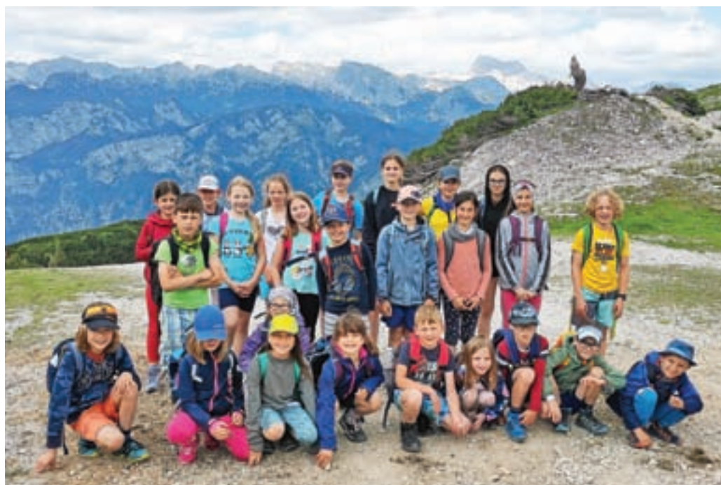
Bilo je zabavno, lepo, zanimivo, poučno in malo naporno. / Foto: OŠ Jezersko

stili v dolino in odšli proti ČŠOD-ju. Tik pred prihodom smo si v jezeru namočili in ohladili utrujene noge. Imeli smo malo prostega časa nato pa delavnice prve pomoči in spoznavanja plezalne opreme in učenje vozlov. Po večerji smo igrali odbojko in badminton. Ob 21.30 smo odšli spat. Zadnji dan smo takoj po bujenju pospravili sobe in odšli na zajtrk. Po zajtrku smo odšli do slapa Savica. Med potjo smo opazovali rastline, živali in prebrali nekaj o nastanku slapu ter jezera. Po kosilu smo se šli kopat v Bohinjsko jezero, po kopanju pa nas je avtobus odpeljal v Kranj, kjer so nas počakali starši. Tabor nam je bil všeč. Bilo je zabavno, lepo, zanimivo, poučno in malo naporno. Z veseljem se ga udeležimo še kdaj. Zoja in Matevž, 3. r