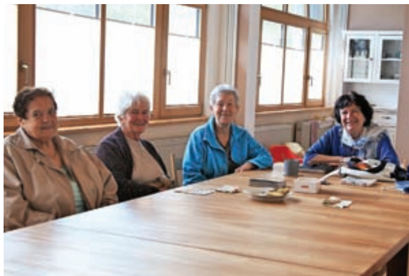
Srečanja se imenujejo Zapišimo spomine