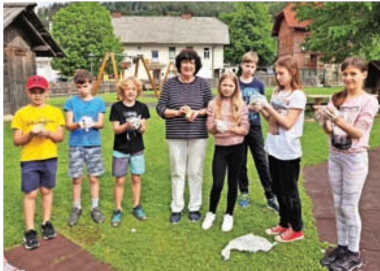
Ustvarjanje na prostem

Kmalu smo imeli kosilo. Po njem so učenci šole Kokra odšli nazaj. Ta športni dan mi je bil zelo všeč. Polona Rogelj, 4. r