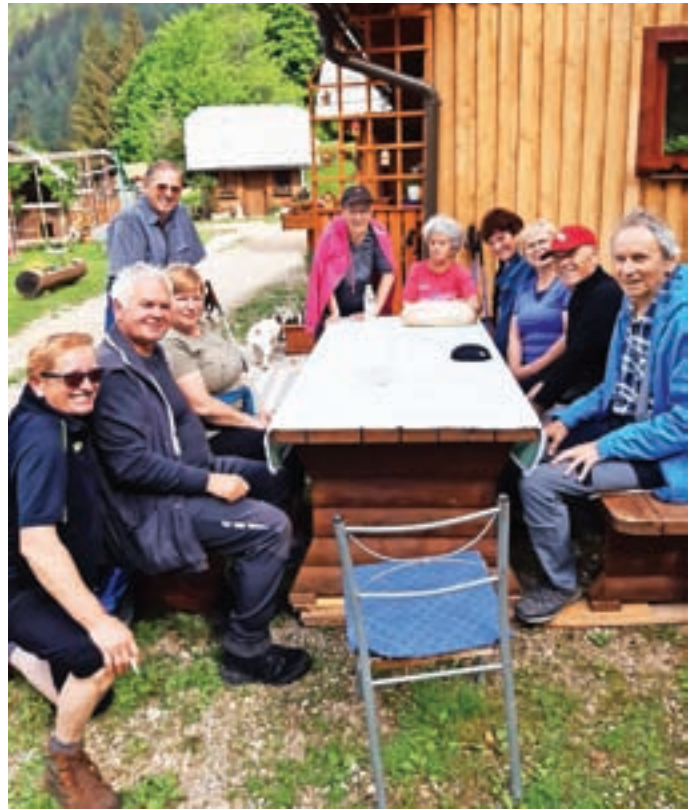
Na Murnovem

Pot nas je potem vodila v Šentjurij pri Mirni Peči, kjer se je rodil nam dobro znani pesnik in vsestranski kulturni delavec Tone Pavček. Obiskali smo muzej, posvečen njegovemu delu, ki nam ga je zelo slikovito predstavila tamkajšnja kustosinja